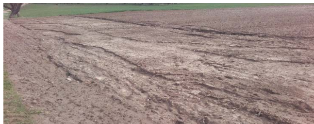
Verhindern Sie Erosionsschäden wie in diesem Frühjahr durch Anlage von Erosionsschutzstreifen!